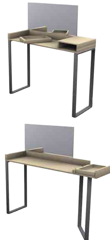
"Axion", design Marion Steinmetz. Prix du public catégorie Petits Meubles.